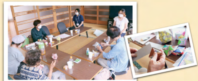
ふれあい型サロン